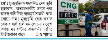
নেশ্যনেল ডেস্ক, অসম বাৰ্তা, ১৭ মে' ৪ মূল্যবৃদ্ধিৰ দপদপনিতে দেশ জুৰি হাৰুকাৰ। অত্যাৱশ্যকীয় ভ্ৰাৰ পৰা আৰম্ভ কৰি নিতা বাৰহাৰ সামগ্ৰী-ক'ভ নুবাণে দাম ৪ মূল্যবৃদ্ধি ৰোধ কৰাত চৰকাৰ বাৰ্থ বুলি সমালোচনা সত্ত্বেও বিগত ২৪ ঘণ্টাত ৰাজধানী দিল্লীত দ্বিতীয়বাৰৰ বাবে □ ৬ পৃষ্ঠাত

বিশ্বজুৰি খাৰুৱা তেলৰ মূল্য তীব্ৰভাৱে বৃদ্ধি পোৱা সত্ত্বেও ভাৰতত পেট্ৰ'ল আৰু ডিজেলৰ মূল্যবৃদ্ধি সীমিত ৪ কেন্দ্ৰীয় মন্ত্ৰী কিৰেণ ৰিজিজু