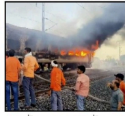
কোটাৰ বতলাম ষ্টেচনৰ সমীপত থিক্কননপুৰম- নিজামুদ্দিন ৰে'লত জুই ৰাজস্থানত চলন্ত ৰাজধানী এক্সপ্ৰেছত অগ্নিকাণ্ড; বিস্ফোৰণৰ ধ্বংস দুটাকৈ ডবা নেশ্যনেল ডেস্ক, অসম বাৰ্তা, ১৭ মে' ৪ চলন্ত ৰে'লত পূৰ্বৰ সংঘটিত হ'ল ভয়ংকৰ অগ্নিকাণ্ডৰ ঘটনা। ৰাজস্থানৰ কোটা জিলাত বতলাম ষ্টেচন আৰু কোটা জিলাৰ মাজবৰ্তী পথত ১২৪৩১ ডাউন □ ৬ পৃষ্ঠাত

পাহাৰবাসী শংকিত; ৩৯২টা ভূমিস্থলনপ্ৰৱণ এলেকা চিহ্নিত