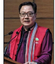
প্ৰতিবন্ধা, খনিজ, ছেমিকণ্ডাক্টৰকে ধৰি একাধিক ক্ষেত্ৰত সহযোগিতা বৃদ্ধি ভাৰত-নেডাৰলেণ্ডৰ মাজত ১৭খন গুৰুত্বপূৰ্ণ চুক্তি স্বাক্ষৰ

□ লকডাউনৰ উৰাবাৰিৰ খণ্ডন □ নিউজ ডেস্ক, অসম বাৰ্তা, ১৭ মে' ৪ পশ্চিম এছিয়াত চলি থকা যুদ্ধ আৰু অস্থিৰ পৰিবেশৰ মাজতে প্ৰধানমন্ত্ৰী নৰেন্দ্ৰ মোদীয়ে দেশবাসীক এক গুৰুত্বপূৰ্ণ আহ্বান জনাইছে। তেওঁ সকলোকে ইহন সঞ্চয় কৰিবলৈ, অপ্ৰয়োজনীয় খৰচ কমাবলৈ আৰু ভয় খাই □ ৬ পৃষ্ঠাত