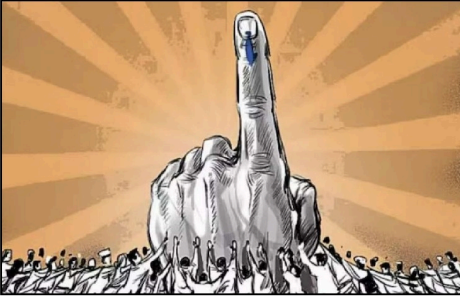
তেতিয়াহে সমাজত প্ৰকৃত গণতন্ত্ৰ প্ৰতিষ্ঠা হয়। যুৱক-যুৱতীসকল কেৱল ভোটচাইৰেই নহয়, তেওঁলোক হ'ব লাগে সমাজৰ একে এৰোজনক অস্তিত্ব প্ৰদৰ্শী।

কি শিতানত খৰচ হৈছে, সেই ধৰণে সঠিক ব্যৱহাৰ হৈছে নে নাই, সেই বিষয়ে চৰকাৰক প্ৰশ্ন কৰিব পৰা মানসিকতা গঢ়ি তুলিব লাগিব। প্ৰশ্ন কৰাৰ অধিকাৰ প্ৰতিজন নাগৰিকৰে আছে। ৰাজহুৱা সমালোচনা আৰু গণতন্ত্ৰক পৰামৰ্শইয়ে এখন চৰকাৰক অধিক সজিয় আৰু জন্মদায় কৰি তোলে। নিৰ্বাচনৰ সময়ত বিভিন্ন ৰাজনৈতিক দলৰ আদৰ্শগত সংঘাত আৰু প্ৰতিযোগিতাৰ ফলত সমাজত প্ৰায়েই এক অদৃশ্য বিভাজনৰ সৃষ্টি হয়। নিৰ্বাচন শেষ হোৱাৰ লগে-লগে এই ৰাজনৈতিক বিভক্ততা বিসৰ্জন দিয়াটো সমাজৰ সুস্থতাৰ বাবে অপৰিহাৰ্য। ইয়াৰ বাবে এক ফলপ্ৰসূ মাধ্যম হ'ল 'সময়ৰ সত্য'। স্থানীয় পৰ্যায়ত গাঁও-বুঢ়া, সমাজসেৱক আৰু চৰ্চনত যুৱক-যুৱতীসকলে উদ্যোগ লৈ নিৰ্বাচন পাছত এখন শান্তি আৰু সন্তোষিত সত্য আয়োজন কৰা উচিত। ইয়াক সকলো দল-মতৰ লোকে কেলেগেলেই অংশগ্ৰহণ কৰি উন্নয়ন বাবে এক উম্মতীয়া লক্ষ্য স্থিৰ কৰিব পাৰে। যেতিয়া ৰাজনীতি উৰ্ধ্ব মত মনোহে সমাজৰ কথা চিন্তা কৰিবলৈ লয়, তেতিয়াহে প্ৰকৃত সমাজিক উন্নয়ন সম্ভৱ হয়। সময়ৰ সত্যই কেৱল গঢ়িব পৰা নহয়, ই বিতৰণৰ প্ৰাৰ্থিতাৰ ভাঙি একেৰে এক নতুন নিৰ্দেশ দাঙি ধৰে।