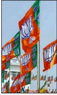
বিবেচনীৰ এই বহু আৰু নিৰ্বাচন পৰিণতী গঢ়াত সহায় কৰিব বুলি আমি আশাৰাৰী।