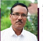
নিশিতা বৃজ্জং ভূজ্জং

১) সূক্ষ্মৰ অধিকাৰ-জীৱন আৰু সম্পৰ্কৰ বাবে হানিকৰক সামগ্ৰীৰ বিক্ৰেতা সূক্ষ্ম লালচ কৰা। ২) তথা জ্বাৰ অধিকাৰ-সামগ্ৰীৰ ওপৰত মান, বিত্তভুক্ত, মূল্য আৰু মানদণ্ডৰ বিষয়ে সৰ্বিশেষে জনাৰ অধিকাৰ। ৩) পণ্য কৰাৰ অধিকাৰ- প্ৰতিযোগিতামূলক বজাৰত নিজৰ পণ্য অনুসৰি সামগ্ৰী বিক্ৰি কৰিব পৰা সুবিধা। ৪) মাননি অধিকাৰ- গ্ৰাহকৰ স্বাৰ্থৰ সৈতে জড়িত সমসাসমূহত উপযুক্ত মৰ্জত উত্তাৰণ কৰাৰ সুযোগ। ৫) বিসংগতি দূৰীকৰণৰ অধিকাৰ- অসুচি বা বিজ্ঞানিক কাৰ্য্যকৰণ বা শোষণৰ বিৰুদ্ধে ক্ষতিপূৰণ বা ন্যায় লাভ কৰা। ৬) গ্ৰাহক শিক্ষাৰ অধিকাৰ- এজন সজাগ গ্ৰাহক হ'লে প্ৰয়োজনীয় জ্ঞান আৰু দক্ষতা অৰ্জন কৰিব পাৰে।