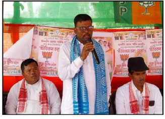
দেখিছোঁ। এইয়া বিজেপি চৰকাৰৰ বাবেই সন্তৰ হৈছে। তেওঁ আৰু কৰ্মীয়ে, কেপ্তৰ বিজেপি নেতৃৱৰ এন ডি এৰ চৰকাৰ, বিচিটিত এন ডি এৰ চৰকাৰ আৰু এইয়া বিজেপি নেতৃৱৰ এন ডি এৰ চৰকাৰ হলেই আমাৰ সৰ্বাঙ্গীন বিকাশ আৰু উন্নয়ন গতি মুকলি হ'ব।

আসাম বার্তা, বকোৰ, ৩ এপ্ৰিল : সন্মত বিধান সভালৈ আৰু মাত্ৰ কেইদিনমান বাকী থকাৰ সময়তে বিজিত ৰাজনৈতিক দলৰ মাজত চলিছে তীব্ৰ নিৰ্বাচনী প্ৰচাৰ। ওপলগুৰি জিলাৰ চলা বিধান সভা সমষ্টিও এই ক্ষেত্ৰত বোৰা নাই পিছলৈ।