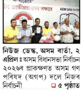
নিউজ ডেস্ক, অসম বাৰ্তা, ২ এপ্ৰিল : অসম বিধানসভা নিৰ্বাচন ২০২৬ৰ প্ৰাক্কালত অসম গণ পৰিষদ (অগপ) দলে নিজৰ নিৰ্বাচনী □ ৫ পৃষ্ঠাত

আপোনালোকৰ পৰা কাটি লোৱা ভূমি ওভতাই দিয়া হ'ব, মুখ্যমন্ত্ৰীয়ে ইয়াৰ বাবে ক্ষমা বিচাৰিব লাগিব