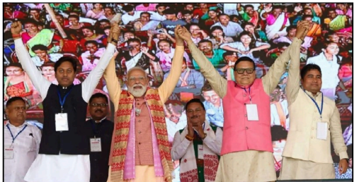
৬০ দিনৰ ভিতৰত জুবিন গাৰ্গক ন্যায় দিব কংগ্ৰেছ চৰকাৰে

অসমত বান নিয়ন্ত্ৰণৰ বাবে ১৮ হাজাৰ কোটি টকা খৰচ কৰা হ'ব : প্ৰধানমন্ত্ৰী নৰেন্দ্ৰ মোদী