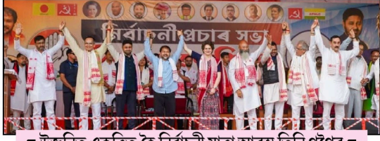
□ উজনিত একত্ৰিত হৈ নিৰ্বাচনী যাত্ৰা আৰম্ভ তিনি গগৈৰ □

নিউজ ডেস্ক, অসম বাৰ্তা, ২ এপ্ৰিল : নিখিল ভাৰত কংগ্ৰেছ কমিটিৰ সভাপতি মাল্লিকাৰ্জুন খাৰ্গে, সাংসদ তথা জ্যেষ্ঠ কংগ্ৰেছ নেত্ৰী প্ৰিয়ংকা গান্ধী আৰু কৰ্ণাটক উপ- মুখ্যমন্ত্ৰী ডি. কে. শিবকুম্বৰৰ পৰে কংগ্ৰেছৰ শীৰ্ষ নেতৃত্বই অসমত নিৰ্বাচনী প্ৰচাৰ অভিযান তীব্ৰ কৰি তোলাৰ মাজতে, আজি অসমলৈ আহিব লোকসভাৰ বিৰোধী দলপতি ৰাহুল গান্ধী। এদিনীয়া □ ৬ পৃষ্ঠাত