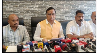
অসম বাৰ্তা, নলবাৰী, ২৮ মাৰ্চ : আজি নলবাৰীত ভাৰতীয় জনতা পাৰ্টীৰ মুখ্য কাৰ্যালয়ত এখন গুৰুত্বপূৰ্ণ সংবাদমেল অনুষ্ঠান কৰা হৈছে।