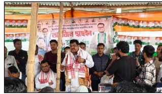
আসন্ন বাৰ্তা, কপৌঠা, ২৮ মাৰ্চ ৫ চামগুৰি সমষ্টিৰ শিঙিমাৰী বজাৰত মাজ মজিয়াত আৰ্জি বিয়লি ভাগত ২৬ ৰ বিধানসভা নিৰ্বাচনৰ বাবে কংগ্ৰেছ দলৰ নিৰ্বাচনী প্ৰচাৰ অস্থায়ী কাৰ্যালয় মুকলি কৰিবলৈ উক্ত কাৰ্যালয় কাৰ্টি মুকলি কৰিবলৈ কংগ্ৰেছ দলৰ প্ৰাৰ্থী আৰ্জি বিয়লি কৰিবলৈ উক্ত কাৰ্যালয় কাৰ্টি মুকলি কৰিবলৈ কংগ্ৰেছ দলৰ প্ৰাৰ্থী আৰ্জি বিয়লি কৰিবলৈ উক্ত কাৰ্যালয় কাৰ্টি মুকলি কৰিবলৈ

সমস্যা ৰাজ্য-ঘাট, দলভৰ বাবে যমৰ যোগত ভুলি আহে সেইধৰে সমস্যা জৰী হোৱাৰ পিছত আৰম্ভ কৰিব বুলি প্ৰতিশ্ৰুতি প্ৰদান কৰে। ইপিনে কেইবাখনো নিৰ্বাচনী সভাত অঞ্চলটোৰ শতাধিক অগণ কৰ্মী আনুষ্ঠানিকভাৱে কংগ্ৰেছ দলত যোগদান কৰে। সমষ্টিটোৰ সকলো শ্ৰেণীৰ বহিঃকৰ পৰা বি সঁহাৰি পাবলৈ সক্ষম হৈছে বুলি মন্তব্য কৰে। উৎপল বণিয়াৰ লগত সৰু সৰু সমস্যা আনুষ্ঠানিকভাৱে সমস্যাটোৰ সমস্যাটোৰ সমস্যাটোৰ সমস্যাটোৰ