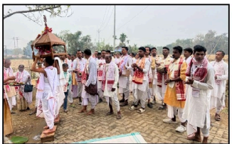
শিৱালয়ত পুজাৰীসকলে পুজাৰীৰ পূৰণি কৰিছে।

অসম বাৰ্তা ডুবুৰাগাঁও, ১ মাৰ্চ : মৰিগাঁও জিলাৰ হিন্দু জাপৰিত চোৰৰ উপদ্রৱ হুৱায়ী লোকক আতংকিত কৰিছে। যোৱা দিনা হিন্দু জাপৰিৰ বৰ নামঘৰটো চোৰে প্ৰাৰম্ভিকভাৱে ভাঙি ফাটাইছিল।