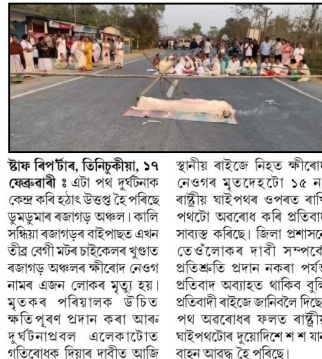
ডুমডুমাৰ বজাগড় বাইপাচত মৃতদেহ লৈ ক্ষুব্ধ ৰাইজৰ ১৫ নং ৰাষ্ট্ৰীয় ঘাইপথ অৱৰোধ